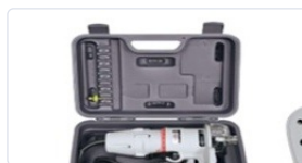
Maletín de transporte