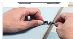
Fresado de cantos