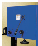
LIBERADOR TENSIÓN CINTA