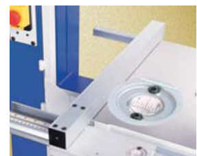
GUÍA RECTA CON LECTOR