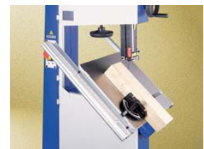
INCLINACIÓN MESA 45°