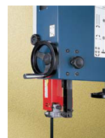
AJUSTE ALTURA GUÍA