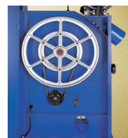
DETALLE VOLANTE INFERIOR