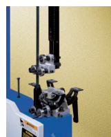
GUÍA RODILLOS SUPERIOR E INFERIOR