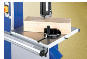
GUÍA INGLETE GRADUADO