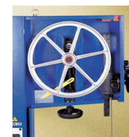
DETALLE VOLANTE SUPERIOR